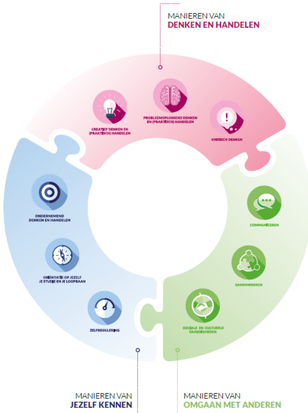
Figuur 3. Het model brede vaardigheden van Curriculum.nu