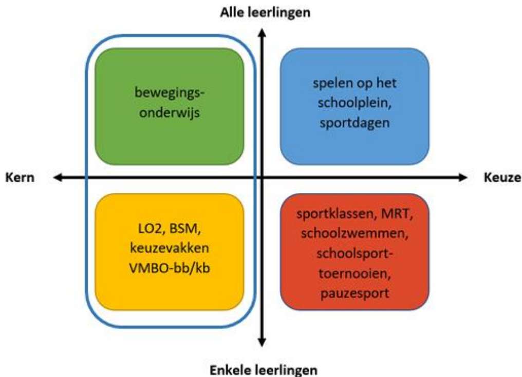
Figuur 2. Kern en keuze in het leergebied Bewegen & Sport met voorbeelden waarop bewegen en sport verschijnt in de onderwijsinstelling.