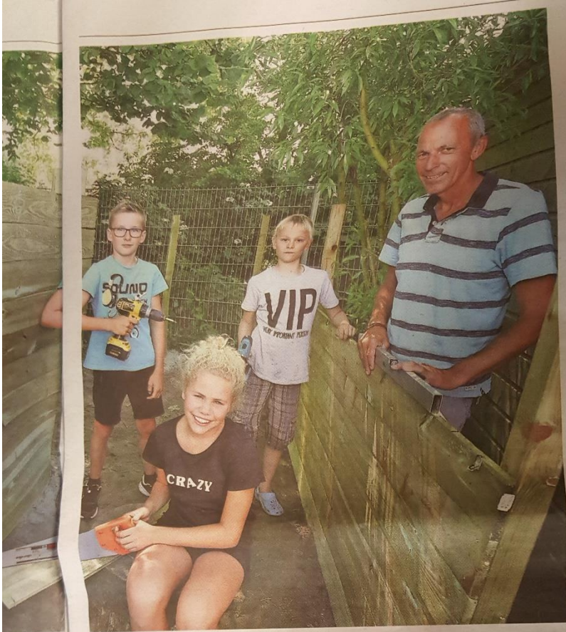
van leergebied Mens & Natuur..