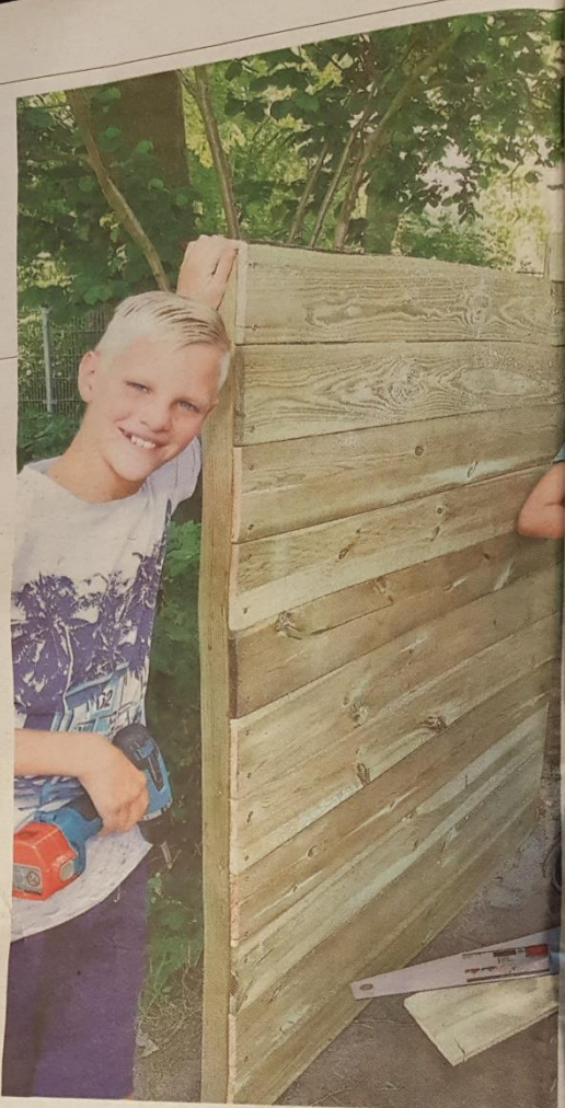
En groep van De Meerkoet bouwt een hut voor de onderbouw in het kader

...gebruik kunnen op ...en worden ... (0224) 224430 of ...e.s@nhd.nl. ... Snuffelmarkt, ...toelenvaart 23-23 ...tel. 0223-53269. ... Inloophuis De ...ar, Molenvaart 23 ...voor ontmoeting, ...sluisterend oor en ...penbare fractie- ...Hollands kroon, ...Ontmoeting, De ...sloop Jongeren- ...19.00-21.30 uur, ...15.00-17.00 uur ...6. ...tTals-nieuwbedrij- ...st, voor werkzo- ...nnegekes Marjan ...a, Oetinsma 2300, ...gast, Torenstraat 1, ...munkalvaarlijk, 15.00 ...ren van drie tot en ...te in bibliotheken ...66, Torenstraat 1, en ...terwal 6. ...marvoud Westfrinc ...18.00-21.00 uur, in ...n Veenburg, Leet- ...tercafé, 18.30 uur, ...in woonwagge- ...ogterlaan 66a, info: ...aar fractieberaad ...meermehuis, Laan ...ms Cocaine Ano- ...18.00-21.30 uur, ...alle drugs, alco- ...ersteravingen, Ber- ...30797133 ...gweg Samen aan- ...uit, in dorpsont- ...kerstraat 86. ...Openbaar fractie- ...nis Kroon, 20.00 ...De Clude School, ...advocatenpre- ...gatus, in Gel- ...stus westerzij ...19-20.00 uur, in ...moord, Gomp- ...en De Hoop, ...voor publiek. ...1265, 11.00- ...Hippo, Kerk- ...ar voor digi- ...te, Stichting ...ngevencen- ...meest, 18.30- ...ar Werk en ...Laan 10- ...19.20 uur, ...de apparat- ...en, Roggen- ...bellarten, ...Kieftlaan